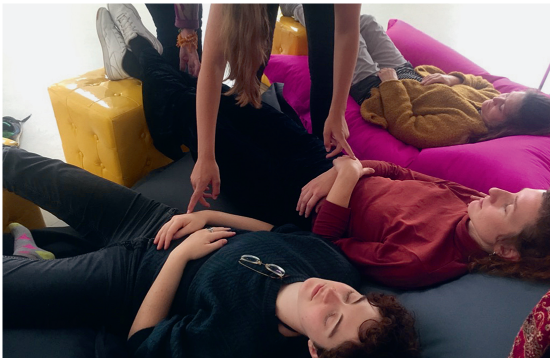
Care für Care-Arbeitende: Impression aus dem Workshop zum Thema Vertrauen mit der Performance-Künstlerin Myriam Lefkowitz im M.1 (September 2019)