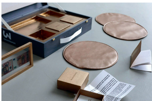
Das Archiv der Begegnungen ist partizipativ und mobil. Konzipiert und umgesetzt von Veronica Andres, Pablo Lapettina, Laura Mahnke und Skadi Sturm The Archive of Encounters is participatory and mobile. Conceptualised and designed by Veronica Andres, Pablo Lapettina, Laura Mahnke and Skadi Sturm

interesting conversations took place and riveting artistic contributions came through on the screen, one question still persisted: what kind of collectivity are we experiencing in digital space at this moment in time?