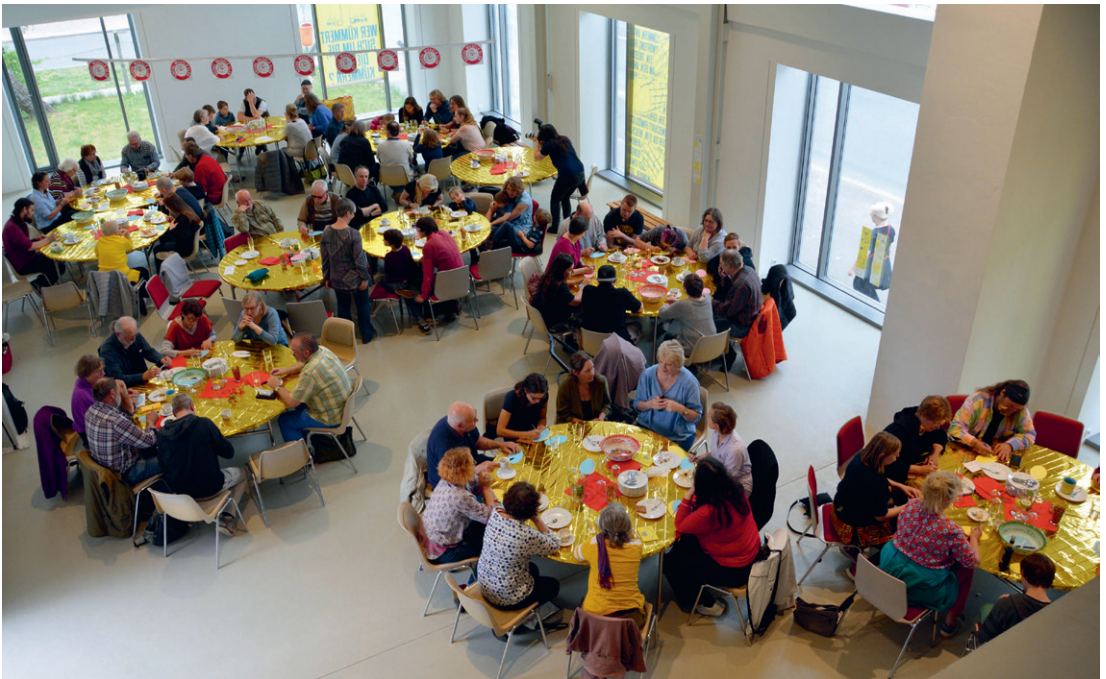
Der erste Social Muscle Club in Schleswig-Holstein fand im April 2019 im M.1 statt The first Social Muscle Club in Schleswig-Holstein took place in April 2019 at M.1

and learned from Hohenlockstedters that unlike the other surrounding villages the place doesn't have a town hall, that there is a lack of meeting spaces, places where community would be able to blossom informally. The highly active life of associations and clubs in Hohenlockstedt as well as that of various church associations usually have their own established spaces. But smaller clubs, especially those unaffiliated with religion or established associations, have difficulty finding spaces for encounter, particularly since pubs and restaurants in the village are increasingly shuttering. It was therefore important to me in Hohenlockstedt to fathom