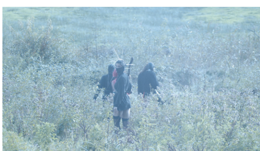
Malu Blumes Film The Book of S of I lädt die Zuschauer*innen in eine Zukunft mit kollektiver Fürsorge ein Malu Blume's film The Book of S of I invites the viewer into a future with collective care

After the decision to hold the cooperating event with the HKW digitally, the necessity of an analogue continuation became increasingly clear. For, digital and physical forms of gathering have to be thought out and practiced in mutual engagement, as the media scholar Felix Stalder articulates: »A culture of digital solidarity can