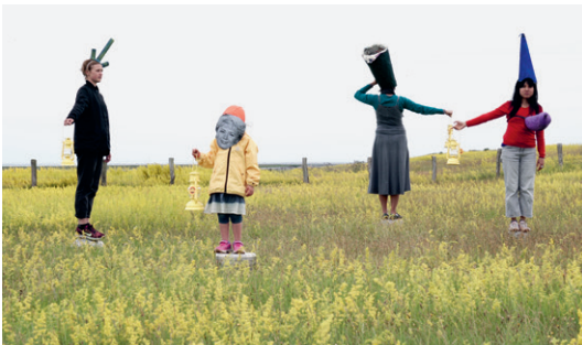
Ob im Lockdown oder nicht: Maternal Fantasies beziehen ihre Kinder in die künstlerische Arbeit mit ein und machen Sorgearbeit sichtbar Whether in lockdown or not: Maternal Fantasies involve their children in the artistic process and make care work visible